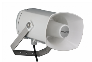
L-LS02 12W Aktiv Horn Lautsprecher