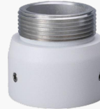
L-HA7 Adapter für Domekameras