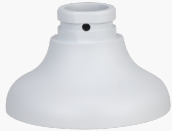
L-HA8 Adapter für Domekameras