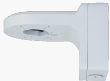
L-WH15 Wandhalter mit Anschlussbox