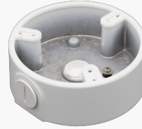
L-AB17 Anschlussbox für Dome-Kameras