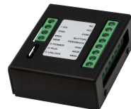
L-ER-5020 Türsprechanlagen Erweiterungsmodul