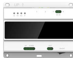
L-SW-5700 2-Draht-Switch für lunaIP Intercom