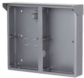
L-RA-5704-AP Aufputzrahmen für Modular Türstationen