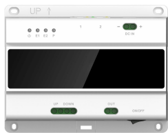
L-SW-5700 2-Draht-Switch für lunaIP Intercom