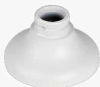
L-HA6 Adapter für Domekameras