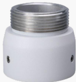
L-HA7 Adapter für Domekamas